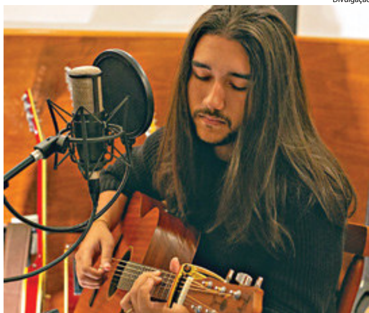
CANTOR prepara live para o mês de junho

A música nasceu no estúdio em casa com o amigo. Mesmo lugar que ele decidiu fazer a primeira gravação. A primeira canção do cantor foi lançada no início de abril. Apesar de já ter gravado em um grande estúdio, no Rio de Janeiro, ele preferiu fazer a primeira versão de ‘Maria’ em casa ao som do violão. “O arranjo, a gravação, tudo foi feito aqui no meu estúdio em casa. Local onde eu já faço pequenas produções tanto para mim, quanto para outros artistas. É um trabalho intimista e produzindo aqui por causa do