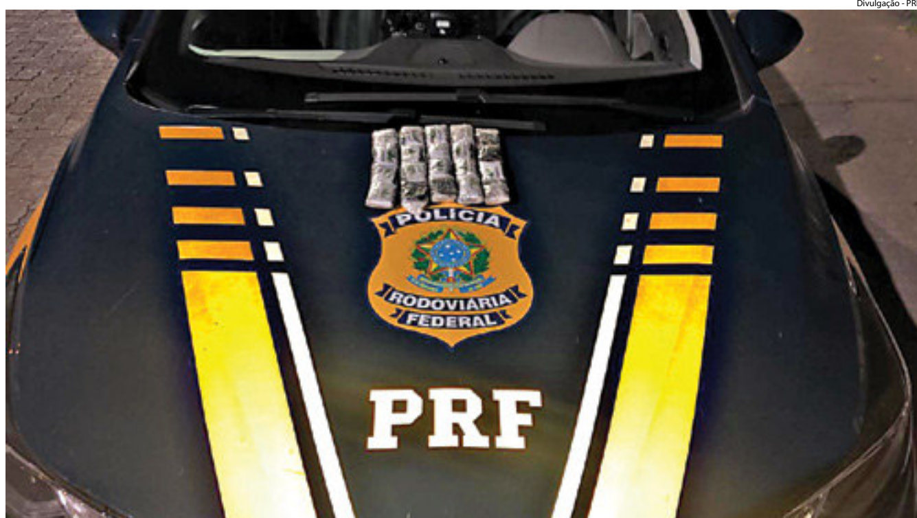
DROGA ADQUIRIDA no Centro do Rio de Janeiro seria levada para Diadema (SP)