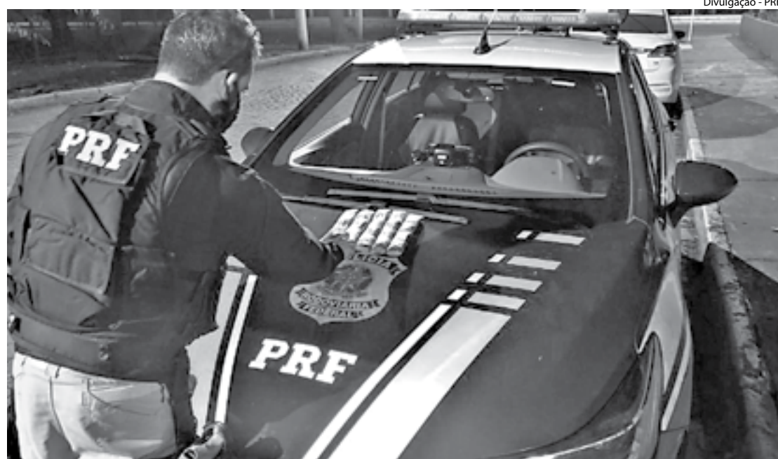
MOTORISTA disse que comprou a droga no Centro do Rio de Janeiro por R$ 20 mil

A ocorrência foi encaminhada para sede da 89ª Delegacia de Resende (DP) para o registro. Os dois elementos ficaram presos à disposição da Justiça. E a droga ficou acautelada com prova do flagrante de tráfico de drogas.