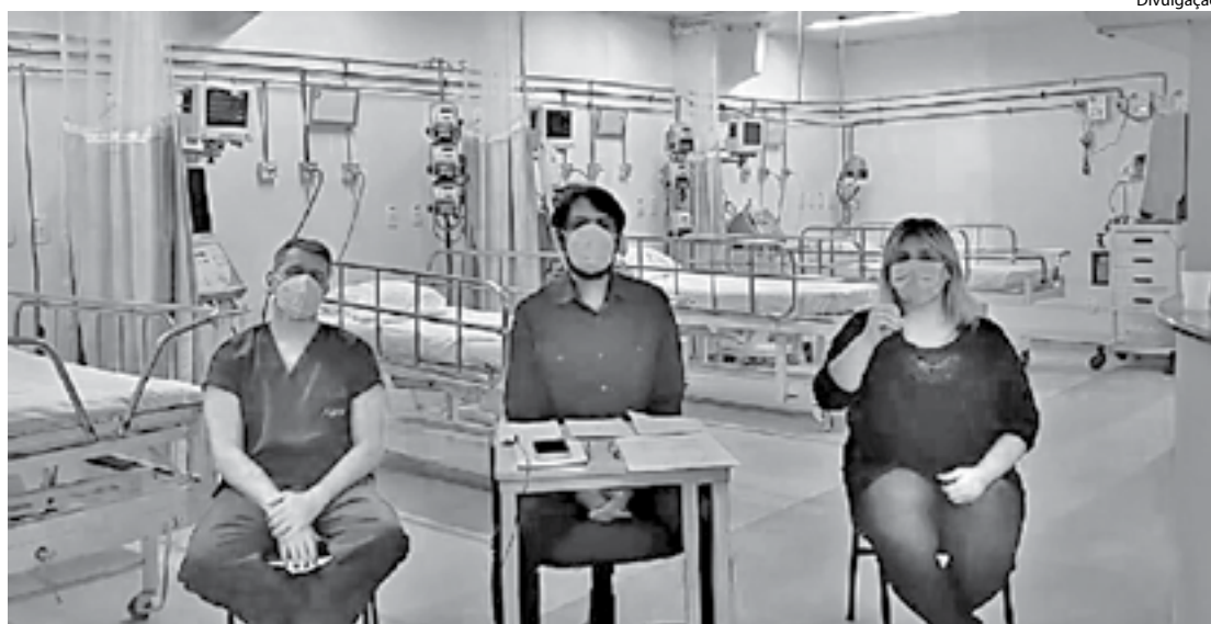
INFORMAÇÃO foi passada pelo prefeito Samuca Silva durante transmissão ao vivo

Os leitos estão prontos e fazem parte do plano operativo. E entrarão em funcionamento de forma imediata caso o número de pacientes aumente na rede municipal de saúde. “Nós não queremos ver o pior para, assim, tomar decisões. Estamos atuando de forma preventiva e antecipada, como criamos o Hospital de Campanha. Caso a demanda de casos de alta complexidade aumente, temos esses leitos para atender a população”, disse o prefeito Samuca Silva.