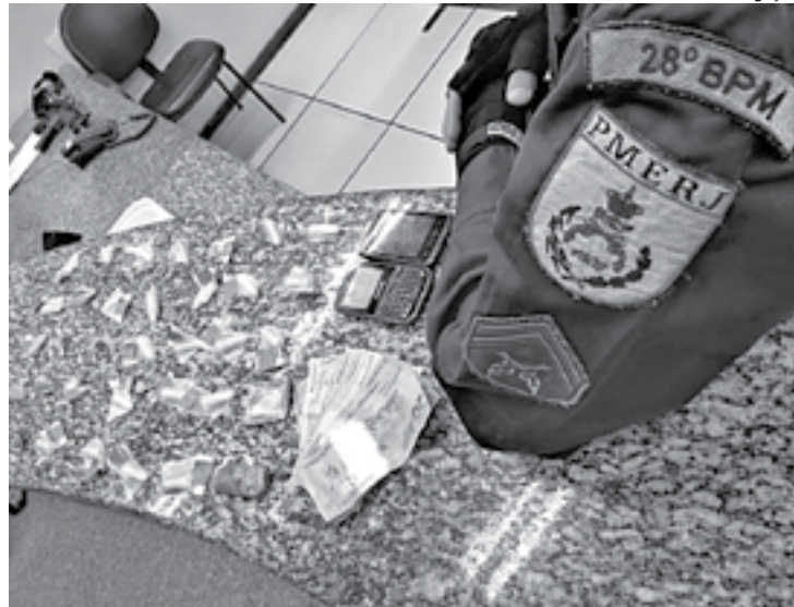
MATERIAL ilícito apreendido foi entregue na 90ª DP onde o caso foi registrado